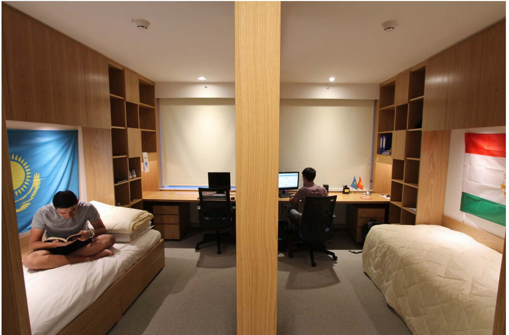
Student Dormitories are designed for privacy as well as interaction, UCA Khorog Campus