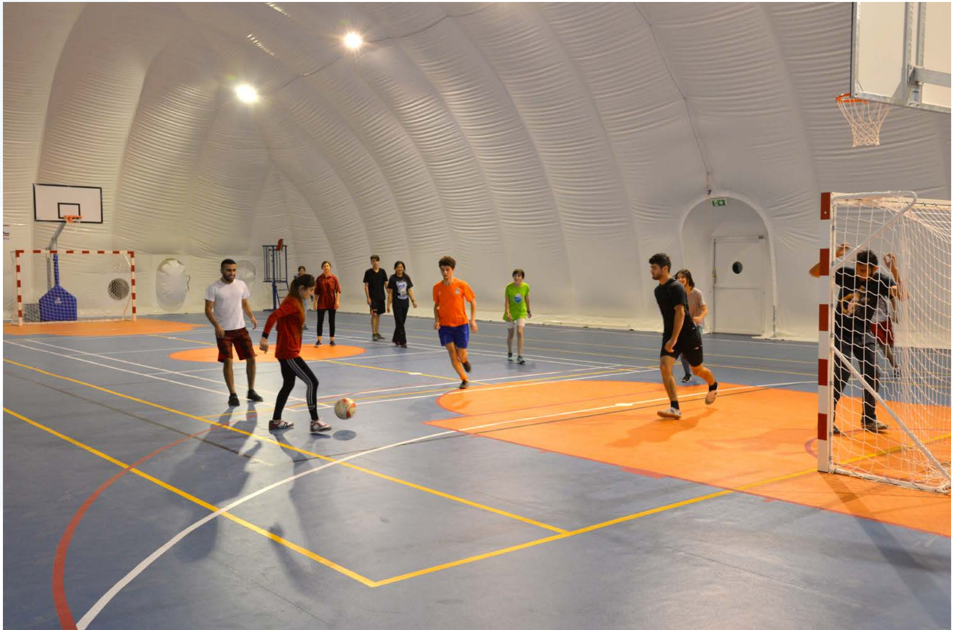
A sports "Bubble" provides year round sports, UCA Khorog Campus