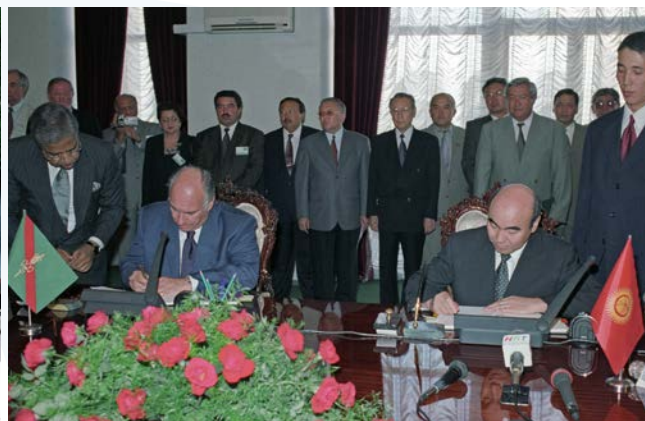
President Askar Akayev of the Kyrgyz Republic Аскар Акаев, Президенти Ҷумҳурии Қирғизистон