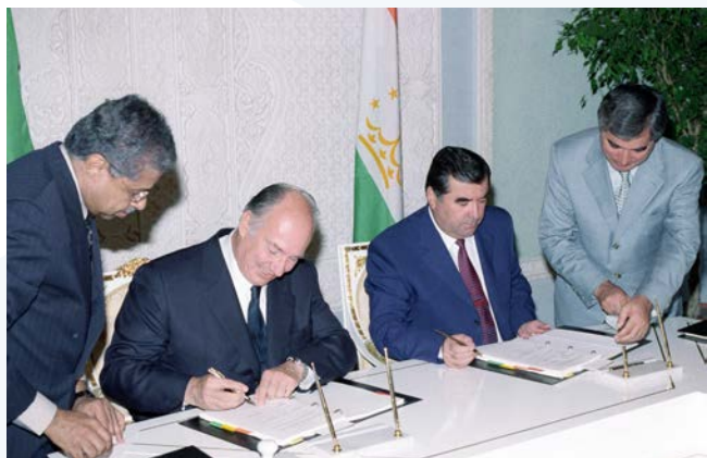
President Emomali Rahmon of Tajikistan Эмомалӣ Раҳмон, Президенти Ҷумҳурии Тоҷикистон

Волоҳазрат Оғохон Ҳангоми имзо кардани Шартнома ва Оинномаи Донишгоҳи Осии Марказӣ бо президентҳои Ҷумҳурии Тоҷикистон, Қирғизистон ва Қазоқистон моҳи июли соли 2000-ум