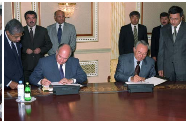
President Nursultan Nazarbayev of Kazakhstan Нурсултон Назарбаев, Президенти Ҷумҳурии Қазоқистон